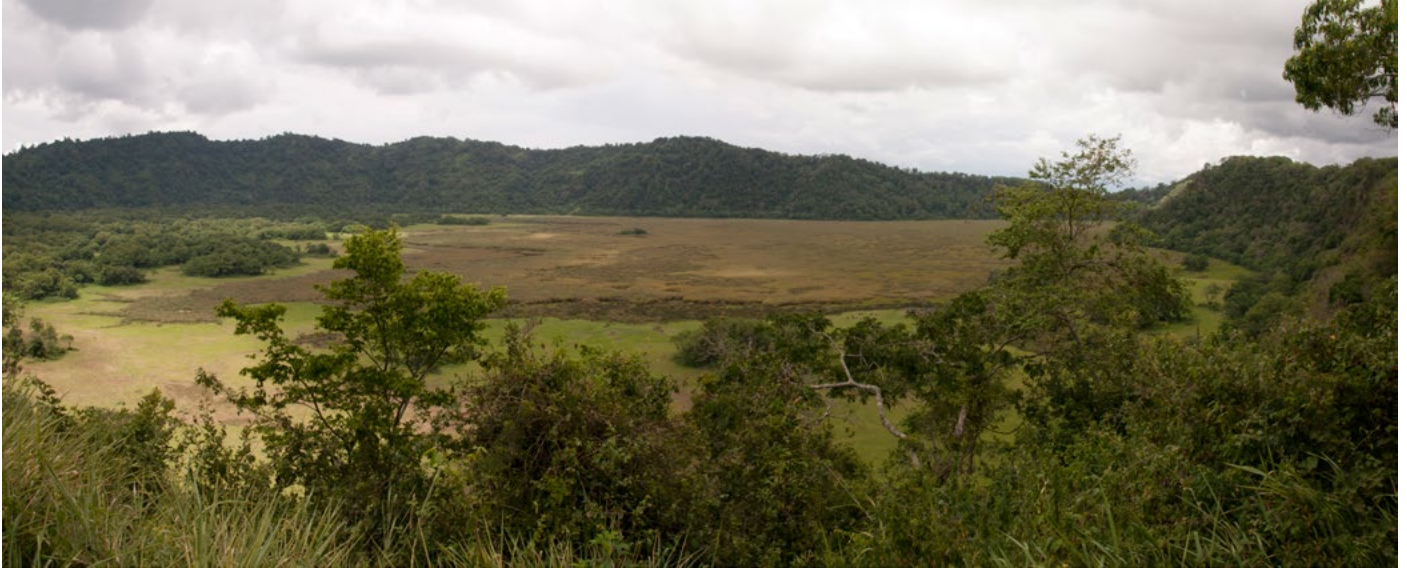
Näkymä Arusha National Parkissa, jonne teimme sunnuntaiajelun