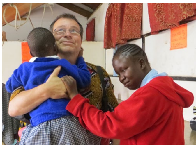
Antti ja kuurosokeat tytöt

Syksyn rupeaman ehkäpä merkittävin kokemus oli vierailumme Nairobissa Kilimani Schoolissa. Opettajien reaktiot vierailun aikana ja sen jäl-keen ovat olleet lievästi ilmaistuna innostuneita. Kilimanin koulun opettajien innovatiivisuus ja sitoutuneisuus monivammaisten lasten kanssa työskentelyyn oli minunkin silmin katsottuna *ihailtavaa. Koulumme opettajat saivat yhden päivän aikana ruiskeen, jonka vaikutus kestää pitkään. Tulemme varmuudella muistamaan Ki-limanin koulun henkilöstöä erittäin arvokkaasta kokemuksellisesta päivästä.