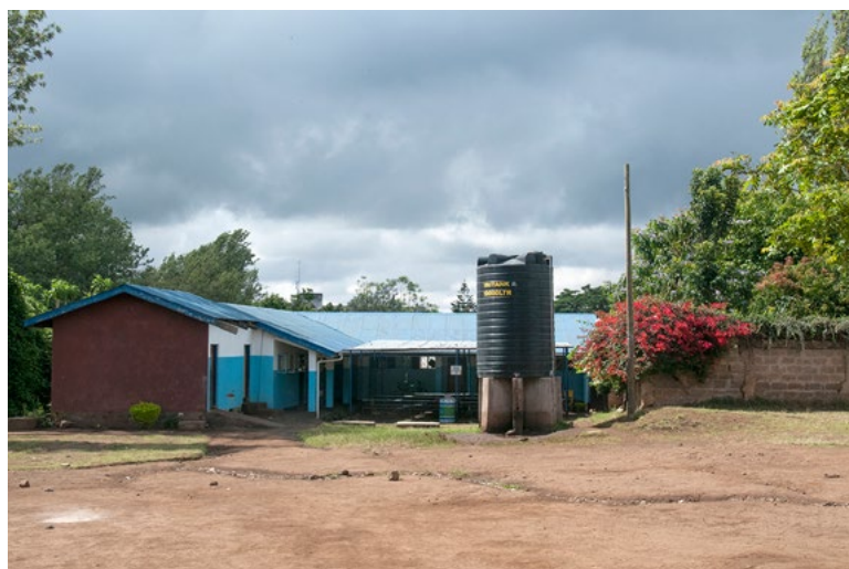
Uusi oppimiskeskus rakennetaan tähän vanhan rakennuksen ja vesitornin kulmalle

Hankkeemme yksi keskeisimpiä tavoitteita on ollut Meru Primary Schoolin yhteyteen rakennettavan oppimiskeskuksen toteuttaminen hankesuunnitelman mukaisesti. Paikalliset olosuhteet ja yhteistyön muodot ovat antaneet meille tilaisuuden oppia hieman toisenlaista toimintakulttuuria.